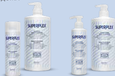
Шампунь для придания холодного оттенка 750/250 мл