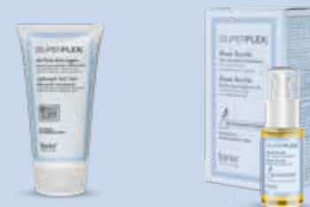
Легкий гель-флюид 150 мл