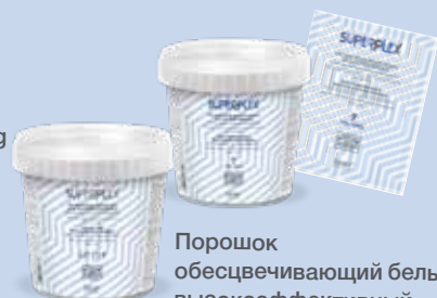
Порошок обесцвечивающий голубой суперэффективный "UP TO 9" обесцвечивание до 9 тонов 400 г