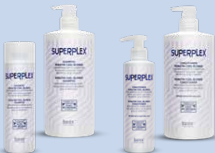
Шампунь Keratin Bonder 750/250 мл