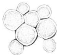
Фильтр Синего Света